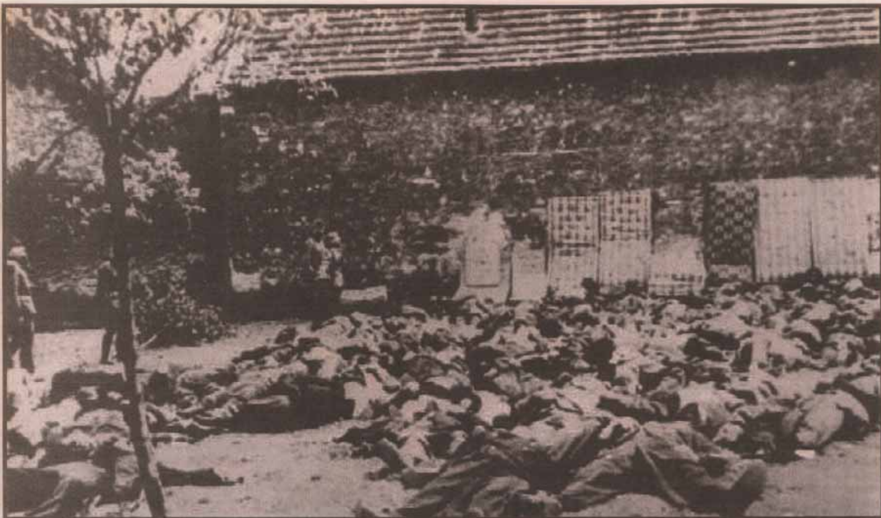
MASSAKERN. Alla män över 15 år i Lidice ställdes upp mot en vägg vid bonden Horaks gård. Här avrättades 173 personer – allt på grund av ett kärleksbrev. Bilden är tagen av nazistyrkor.