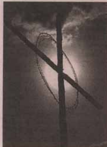
MONUMENT ÖVER DÖDEN. Korset vid massgraven i Lidice där 173 män sköts. Totalt döddes 340 Lidicebor i massakern.

– Vårt samtal fördes via tolk. I all min lycka över att få träffa min mor var jag väldigt frustrer-