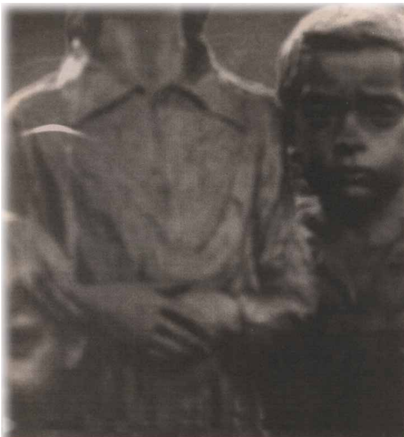
från att gasas ihjäl av nazisterna. 88 barn från byn dog, 82 skickades till gaskammaren.